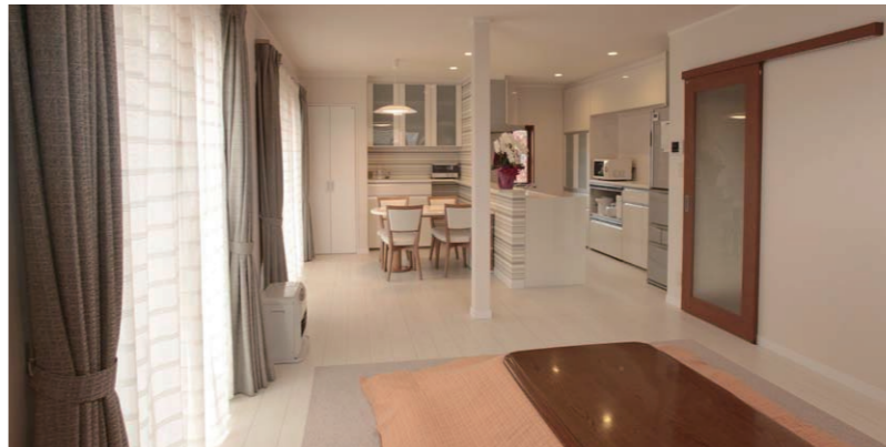
広く・明るく・暖かくなったLDK。内装はオフホワイト系で統一