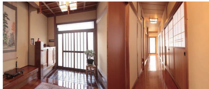
輝きが戻った廊下と玄関

こうした状態を何とかしたいと出かけたのが綿半リフォーム。そこで見た白のモダンなリビング、新和風のシックなリビングなど、どれも素敵なイメージに「我が家もリフォームすればこんな暮らしができるのか」と、夢が大きく膨らみ、何年か漠然と考えていたリフォームに踏み切りました。